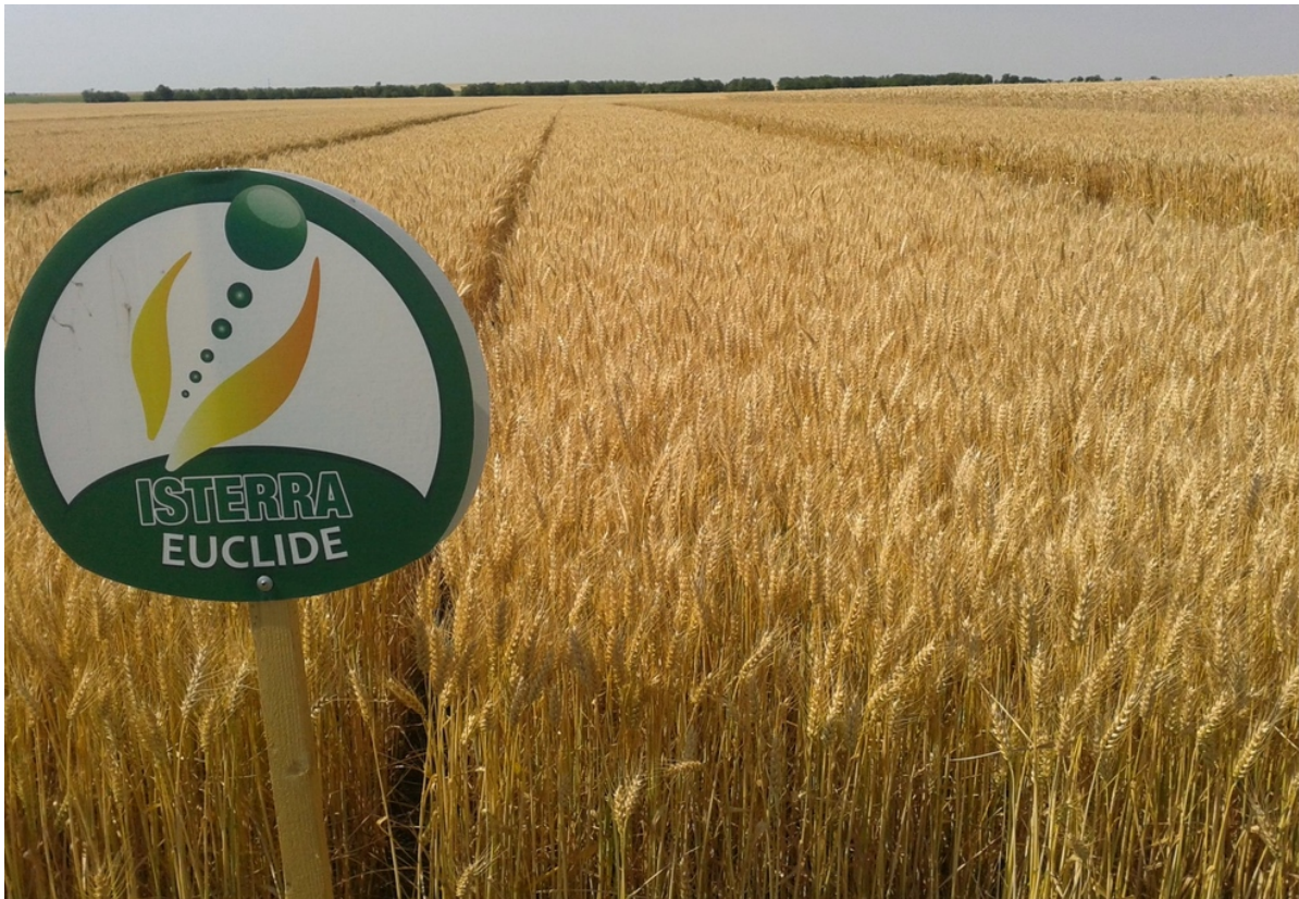
Az Euclide kiválóan alkalmazkodik az eltérő körülményekhez

Újdonságokban is bővelkedik az idei kínálatunk. 2020 őszén négy új őszi búza fajtát próbálhatnak ki partnereink. A NÉBIH friss elismerései közül kiemelkedett a Frenetic, ami a termés és minőség tökéletes kombinációja. Minősítésekor a szemtermése a standard fajták átlagát 11,3 %-kal múlta felül korai, átlag feletti bokrosodással. Az idei év GOSZ-VSZT kísérletében a legnagyobb termést adó minőségi búza.