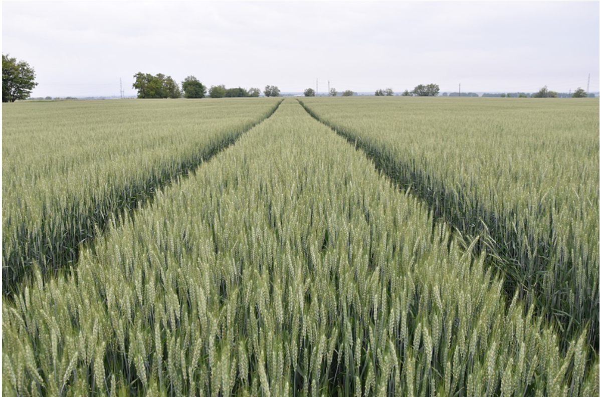
A Basilio terméseredményei magukért beszélnek

A szélsőséges időjárás és a folyamatosan változó szabályozások új kihívások elé állítják a nemesítőket és a termelőket is. Azok a fajták maradnak hosszú évekig a köztermesztésben, amelyek eltérő évjáratokban is a legjobbak között végeznek. Ezért az új, korszerű fajtáknál a magas termőképesség mellett a stressztűrésre történő nemesítésre még nagyobb hangsúlyt fektet a cég. Az Isterra fajtái ellenállóak, a jó víz és tápanyaghasznosító képességük miatt alkalmasak arra, hogy korszerű technológiával sikeres és jövedelmező legyen a termesztésük.