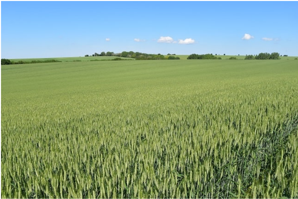
Az Ortolan az egyik legjobb alkalmazkodó képességű korai fajta

A multinacionális cégek között továbbra is egyedülálló módon hazánkban működő őszi búza nemesítő állomásunk a hazai és a régió szomszédos országainak piacaira is nemesít fajtákat. Így a régióra jellemző időjárási és termőhelyi adottságokhoz leginkább alkalmazkodó búzák kerülhetnek minősítésre és forgalmazásra ezzel is biztosítva a termelők által jogosan támasztott legmagasabb igények kiszolgálását. A 2020-as őszi vetéssel az állami elismerés folyamatába kerültek az első, már Fűzesabonyban keresztezett fajták. Reméljük hamarosan ezek a fajták is tovább erősíthetik az Isterra kínálatát.