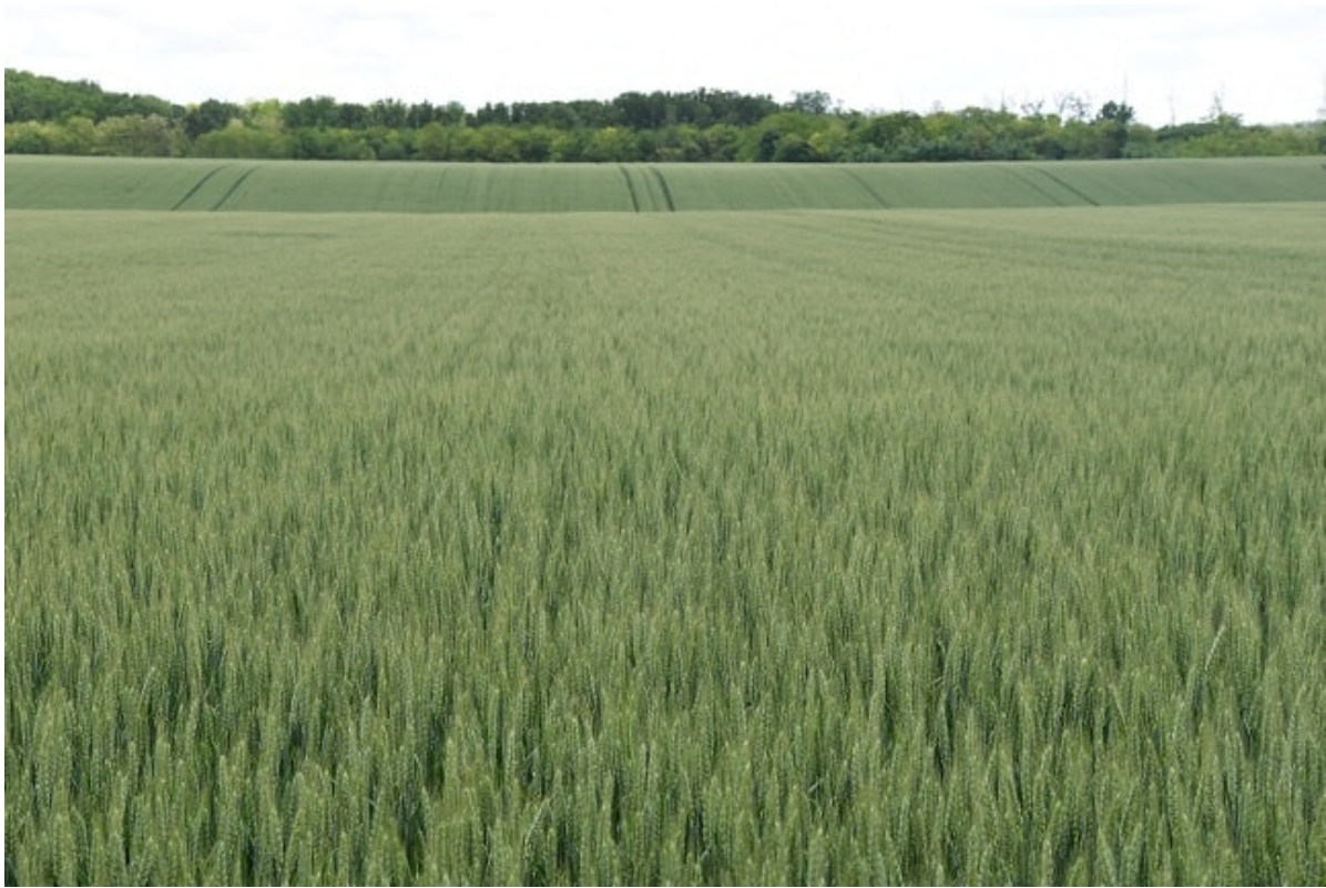
A Cellule aszályos években is kiválóan teljesítő középérésű Isterra fajta